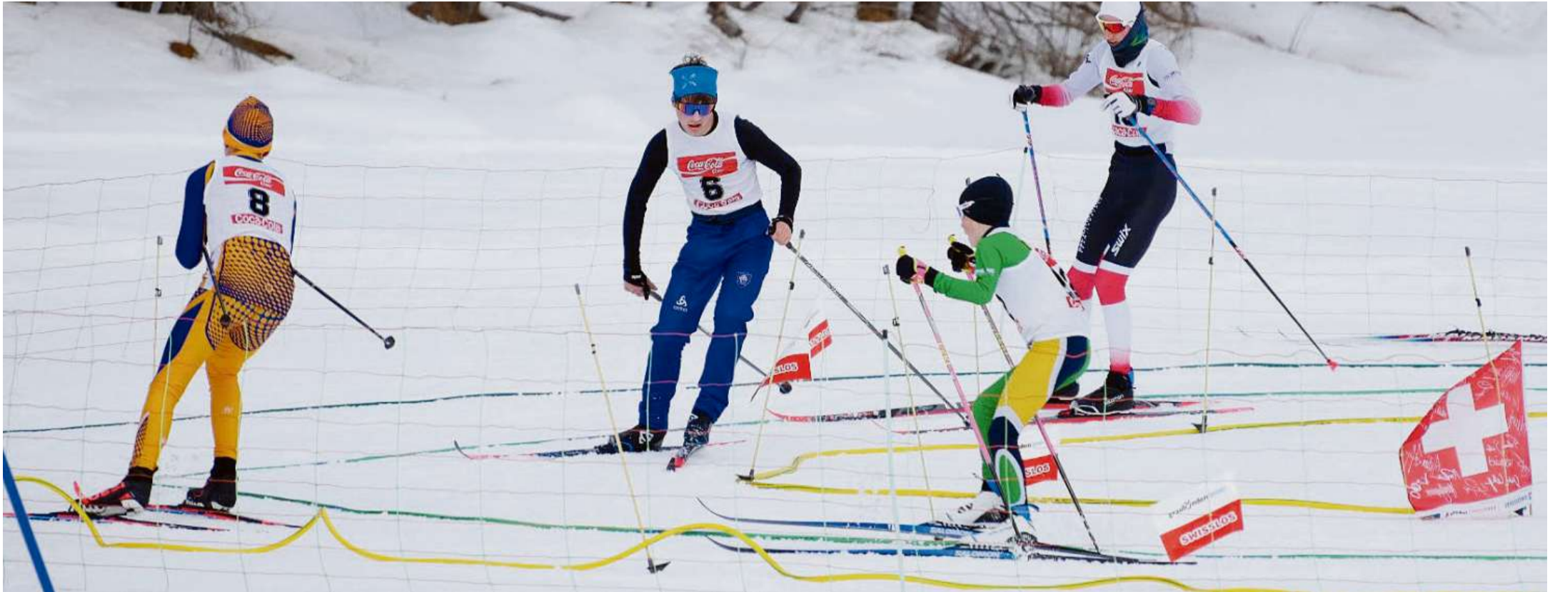
Concentraziùn cumplagn a passànd igls impedimaints.